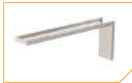
a4086 Кронштейн BS-K-3 (для крепления перпендикулярно плоскости стены)