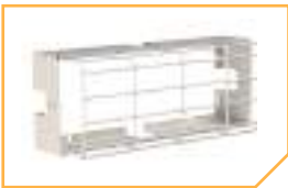
a2333 Решетка защитная BS-R-1